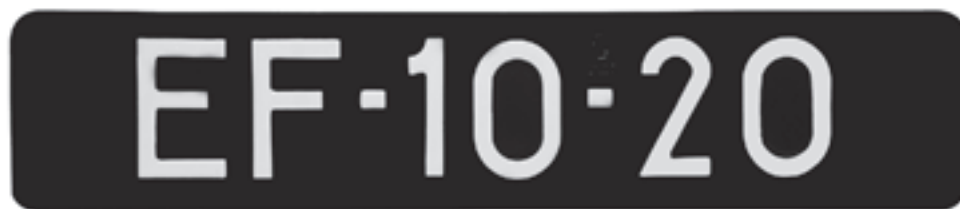
Historische donkerblauwe kentekenplaat