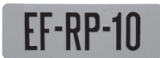
Kentekenplaat Amerikaans model (afgegeven voor 31 augustus 2002)