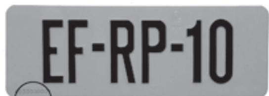
Lamineercode Kentekenplaat Amerikaans model (afgegeven na 30 augustus 2002)